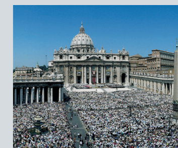
→ San Juan Pablo II canonizó al fundador del Opus Dei en la plaza de san Pedro, ante más de 300.000 personas llegadas de todo el mundo.

El 6 de octubre de 2002 san Josemaría fue declarado santo por san Juan Pablo II. Su fiesta se celebra cada año el 26 de junio.