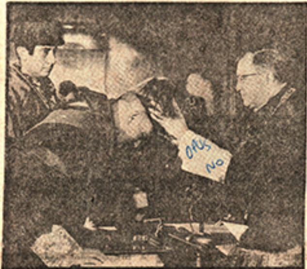
Momento de la investidura como doctor "Honoris Causa" del rector de la Universidad de París.

mostrado imaginación, audacia y un recto sentido del tiempo. Es un esfuerzo pionero en Europa y una respuesta a la naturaleza de la sociedad contemporánea.